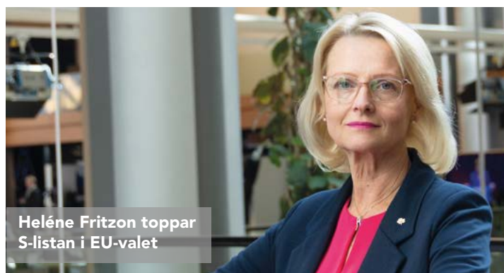
Heléne Fritzon toppar S-listan i EU-valet